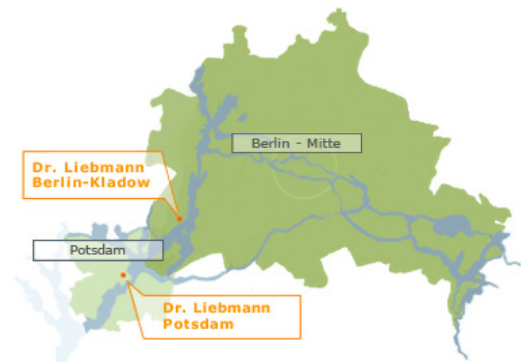
Lage in Berlin/ Potsdam