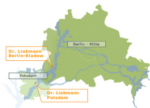
Plan de Berlin/ Potsdam