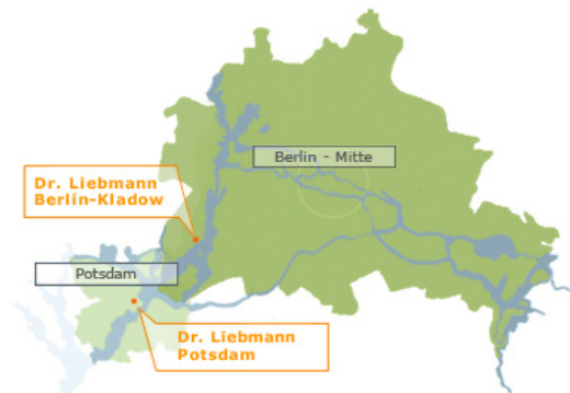
Plano de situación en Berlin/ Potsdam